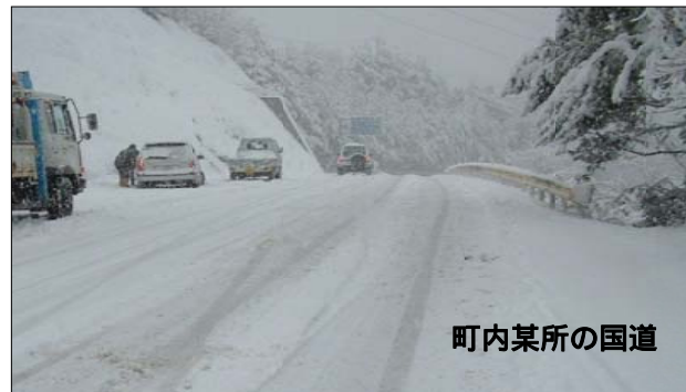
いくら地球温暖化でも、降るときゃ降る。 「ギュギュッ!」と効くタイヤで走りたいですね。