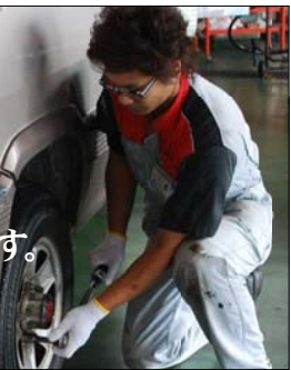
トルクレンチという専用工具で、一定の強さに締め付ける。強すぎても弱すぎてもいけないし、勘だけに頼らないのはプロとして当然だ

通常、タイヤ交換にご来店された場合の手順は・・・ まずお客さまがお持ちになったタイヤをお車から降ろして、タイヤの状態を調べます。 *溝の深さは必要なだけあるか? *製造から何年経っているか? ゴムが硬くなっていないか? *ゴムが劣化して発生するひび割れが無いのか? *タイヤの横など鋭利な物で傷が入っていないか? 釘などが刺さっていないか? *空気を入れるバルブからの空気漏れがないか? *バルブの付け根がゴムの劣化で亀裂が入っていないか? などの状態を確認したうえで、空気圧の調整をします。ここまでやってやっとタイヤ交換の準備が出来るんです。もちろんプロの仕事ですからあっという間に済ませはするのですが、それでも4本あればこの準備までで最低でも10分はかかります。