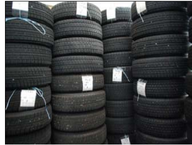
体力勝負！根性で整理整頓だ 4本ごとに名札で管理します

床が板張りの、2階のお預りタイヤ専用保管庫で、タイヤを積み下ろし、転がす音が響きます。