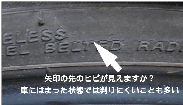
良く見ると「ゲゲッ!」こんなところにも。 写真に写らない小さなヒビもいっぱいだ。

硬く、もろくなったタイヤはひび割れを起こしたり、スリップしやすくなります。 こうなってはせっかくのタイヤが台無しです。