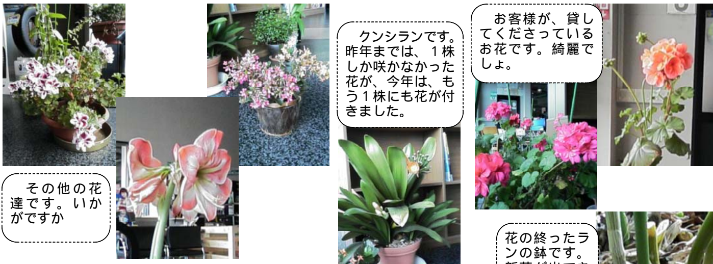
お客様が、貸してくださっているお花です。綺麗でしょ。

桜につつじ、水仙や椿、山も若葉色に染まり、美しい季節です。今年はなかなか暖かくなりませんが、花は少しずつ咲き始め、山も少しずつ色づきはじめました。皆さまの周りも、花が咲きはじめましたでしょうか。さて、我が社でも、鉢植えの花が咲き、美しい姿を見せてくれます。