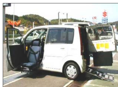
○福祉車両 ムーブ○ 少し先輩のムーブです。こんなことも出来るのです。よろしくお願ひします。

現在、待機中(この後すぐに代車に出ました)のタントです。ほかの新車は、全て仕事中です。